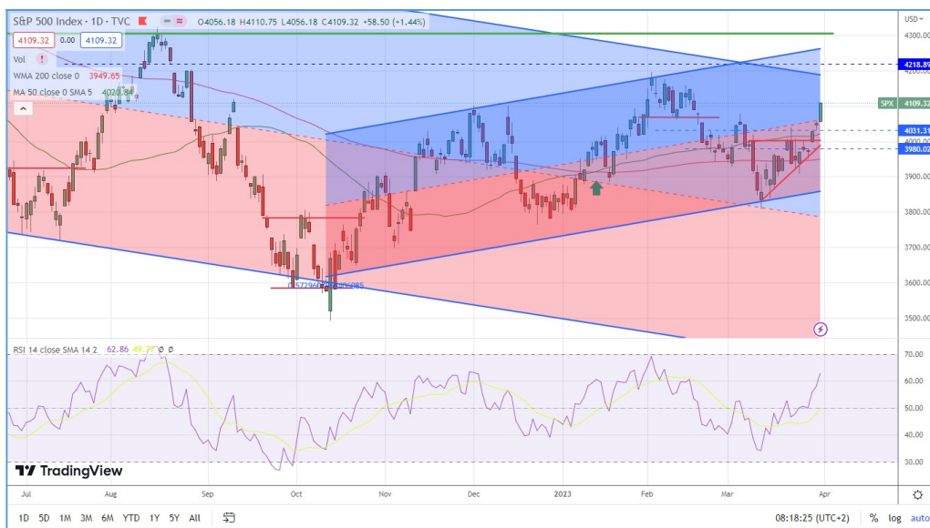
График 1. Динамика индекса S&P 500 в 2022-2023гг.