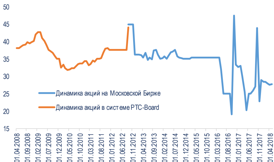
Динамика котировок в сопоставлении акций компании за всю историю торгов

Ликвидность торгов осталась очень невысокой, но волатильность на больших интервалах возросла.