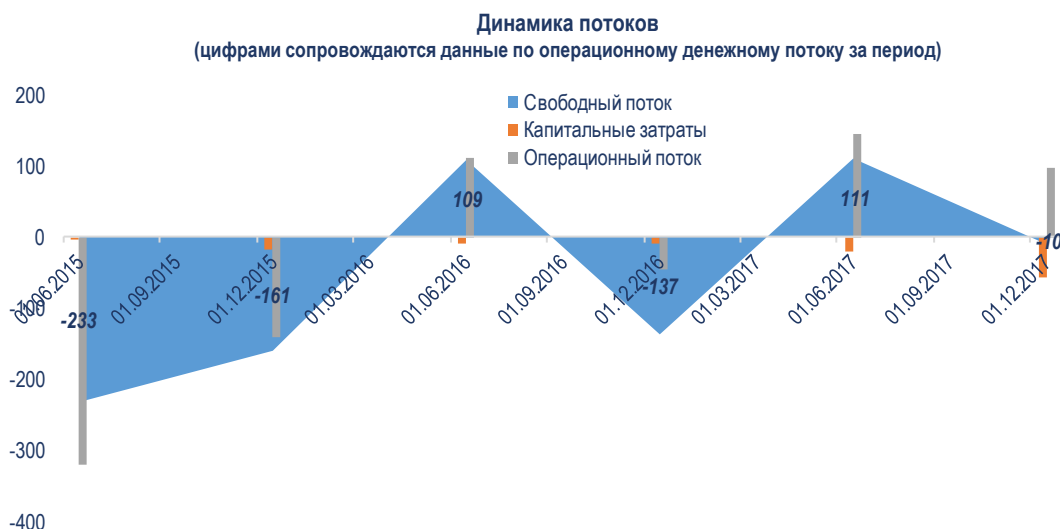
Динамика основных финансовых и рыночных показателей. Приведены в квартальной разбивке, по стандартам РСБУ

Мы отмечаем существенное улучшение финансовых результатов по итогам 1К 2018, компания подтверждает, таким образом, значительный запас прочности и потенциал для развития.